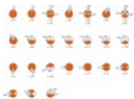
Posizione di funzionamento