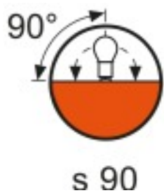
Posizione di funzionamento