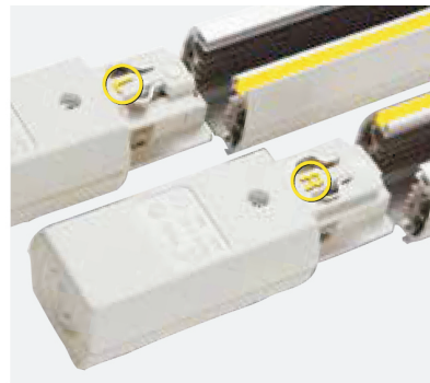
Conduttore di terra con alimentazione sinistra L