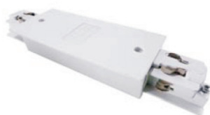
Alimentatore centrale e giunto lineare

333203 bianco sinistro 333201 bianco destro