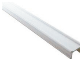
Copertura del binario 1m