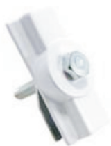
Supporto per fissaggio proiettore