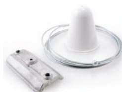
Cavo di sospensione 2m