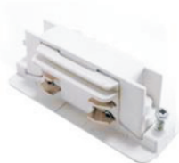
Giunto elettrico lineare