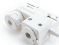
Adattatore elettromeccanico per proiettore max. 6A, 5kg