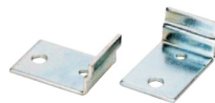
Staffa di fissaggio per sospensione