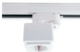
Presa | max. 2300W